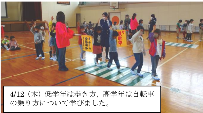
4/12(木)低学年は歩き方、高学年は自転車の乗り方について学びました。