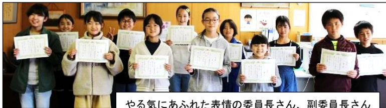
やる気にあふれた表情の委員長さん、副委員長さん

上記の「笑顔のもと」には、人とのコミュニケーションに関わる内容（＝他者意識）と自分に関わる内容（＝自己有用感・達成感）の2つがあることがわかります。ですから、私たち大人が、子供達の他者意識にあふれた言動や本人の頑張りがあった時に認めたり褒めたりすれば、子供達は笑顔になるはずで